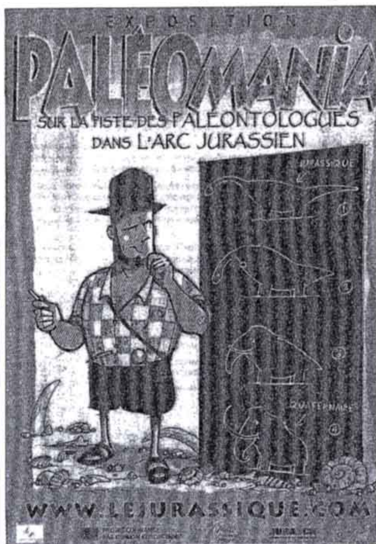
Une affiche made in Jura par un dessinateur sanclaudien

Les recherches aboutissent à plusieurs projets tels que l'exposition trilingue itinérante « Paléomania, sur les pistes des paléontologues dans l'Arc Jurassien », le site internet, une publication trilingue « Jurassique, Jura : métamorphoses d'un paysage », un programme de sensibilisation pour les enfants.